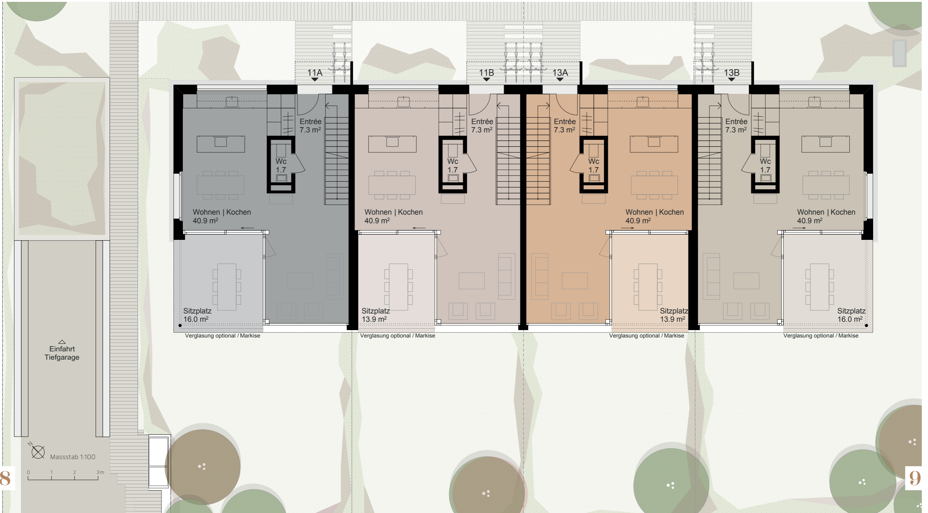
EINFAMILIENHAUS 13B 6½-ZIMMER